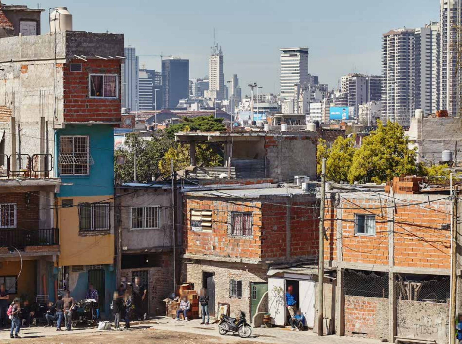
(Figura 1) Villa 31, Ciudad Autónoma de Buenos Aires, Argentina, 2014.